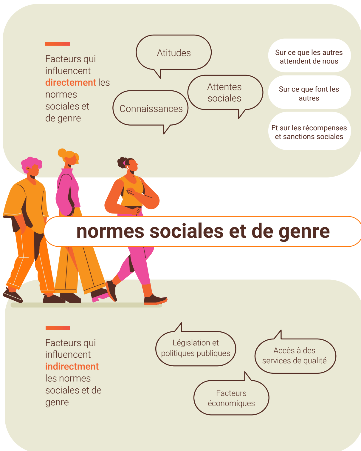
Figure 1. Qu'est-ce qui influence les normes sociales et de genre ?